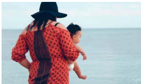
Reklamné agentúry sľubujú bezdetným párom splnenie ich sna o dieťati. Výsledok však býva často frustrujúci.

Dohovor o právach dieťaťa, ratifikovaný 195 krajinami sveta, hovorí o tzv. „najlepšom záujme dieťaťa“, ktorý má byť prvoradý. ZM má však za cieľ dieťa iba sprostredkovať, pritom ignoruje princíp najlepšieho záujmu dieťaťa, ako aj ďalšie základné ľudské práva - právo poznať svoj pôvod, právo na identitu a iné. Podľa Všeobecnej deklarácie ľudských práv ide tento postup proti ľudskej dôstojnosti. Dieťa sa stáva objektom obchodu, je objednávané, predávané, selektované. Tento proces naplňa kritériá komodifikácie dieťaťa i tela ženy, ale aj kritériá eugeniky. Z „túžby po dieťati“ sa stáva biznis