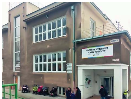
Nové viacgeneračné rodinné centrum Mamy Margity na Pavlovičovej ulici obsahuje pod jednou strechou poradne, ambulancie, materské centrum a škôlku.

Máme túžbu byť centrom, ktoré posunie dopredu aj liečbu diagnostiky neplodnosti a prinesie koncept rodinného lekára. Táto liečba už dávno presahuje horizont gynekológie. Dlhodobým cieľom nás všetkých, ktorí pracujeme v našom centre, bolo, aby sa táto problematika riešila komplex-