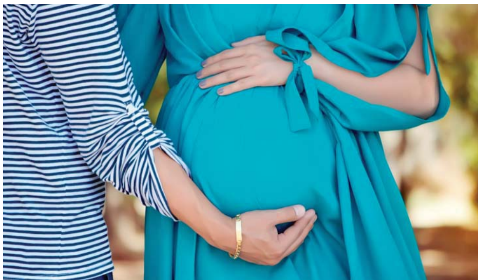
Náhradné materstvo je navodenie špecifickej tehotnosti s následným skorým odlúčením od matky, čo môže spôsobiť zmeny na štruktúrach mozgu dieťaťa i matky.

Skoré oddelenie matky od dieťaťa znevažuje aj ďalšie dôležité procesy spojené s tehotenstvom, a to bonding a laktáciu. Tieto procesy sú pre vývoj matky a dieťaťa veľmi dôležité. Bonding je krátke obdobie tesne po pôrode, počas ktorého sa budujú základy emočných väzieb dieťaťa a matka si s ním vytvára špecifický vzťah. U matky vtedy dochádza k integrácii „mentálneho obrazu“ dieťaťa vznikajúceho počas tehotenstva. Bonding mení bolesť a zjemňuje prežívanie pôrodu. Narušenie tohto obdobia môže mať rozsiahle psychologické následky: separačnú úzkosť a neurotické poruchy dieťaťa; u matiek popôrodnú depresiu, posttraumatickú stresovú poruchu a iné. Svetová zdravotnícka organizácia považuje obmedzenie tohto skorého kontaktu matky a dieťa za preukázateľne škodlivé, čo by podľa nej mala zdravotná starostlivosť zohľadňovať.