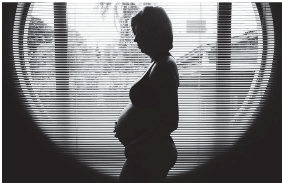
Surogácia je úplne zakázaná vo Francúzsku, Nemecku, Fínsku, Nórsku, Švédsku, Portugalsku, Taliansku, Srbsku, Španielsku, Slovinsku, Švajčiarsku, Turecku, USA (New York, Michigan, Louisiana...).

Muž-objednávateľ má na rozdiel od ženy-objednávateľky podstatne jednoduchšiu cestu k uznaniu svojho otcovstva, čo však neznamená, že bez komplikácií a s istým výsledkom. Otcom dieťaťa porodeného náhradnou matkou sa stane v prípade, že je náhradná matka slobodná, muž, ktorý spolu s ňou urobil súhlasné vyhlásenie rodičov pred matričným úradom alebo súdom (§ 91 ods. 1 a 2; 2. domnieka otcovstva). Takéto vyhlásenie môžu títo dvaja vykonať aj pred narodením dieťaťa, ak už je počaté (§ 92). Matrika ani súd nezistujú, či je daný muž aj biologickým otcom. Takže aj v prípade využitia spermií od anonymného darcu môže byť muž-objednávateľ zapísaný ako otec dieťaťa. Ak je náhradná matka vydatá alebo ak od zániku manželstva či od vyhlásenia jeho neplatnosti ešte neuplynulo viac ako 300 dní, za otca