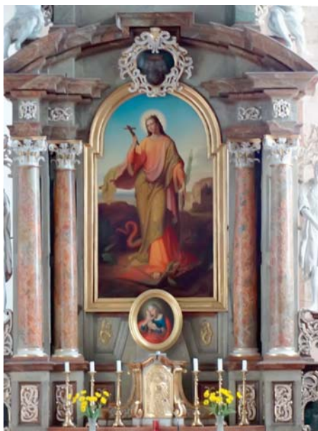
Oltárny obraz z Kostola sv. Margity v Marcheggu, Rakúsko.