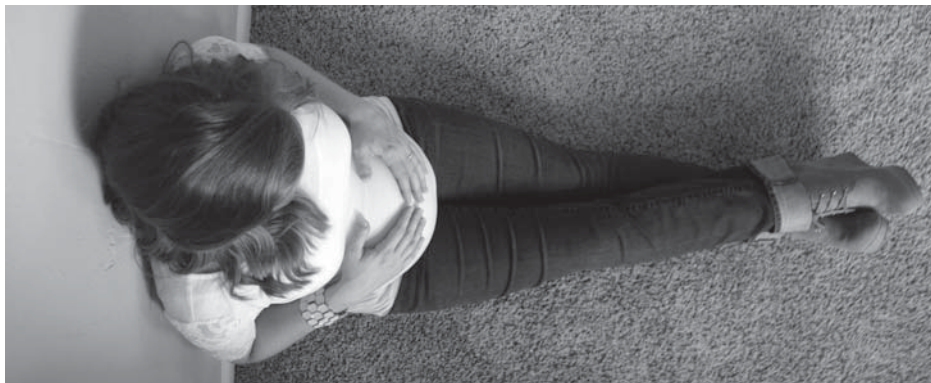
Náhradná matka si buduje silný citový odstup od dieťaťa a tým nepriaznivo ovplyvňuje jeho ďalší vývoj.

Dojčenie je ďalší proces, ktorý ZM ignoruje. O benefitoch a dlhodobých účinkoch materského mlieka niet pochyb, avšak dojčenie má významný vplyv aj na matku, ovplyvňuje ďalšie procesy v jej tele, má celkový ochranný účinok súvisiaci aj s maligným zvratom. Zohľadňujúc poznatky o dojčení, sa medzi prekážky radia len veľmi závažné ochorenia a kontraindikácie matky. Napriek tomu v procese ZM ide o cielene znemožnený kontakt matka - dieťa, bonding aj laktáciu. Odráža sa to nielen na zdraví, ale aj na psychike všetkých zúčastnených. Okolnosti sa umocňujú tým, že na začiatku tohto procesu stoja metódy IVF, ktoré so sebou prinášajú riziká nielen pre matku a dárkyňu pohlavných buniek (ak je použitá), ale predovšetkým pre vytúžené dieťa. Štúdie potvrdzujú, že deti narodené prostredníctvom asistovanej reprodukcie častejšie trpia nízkou pôrodnou hmotnosťou, majú vyššie riziko predčasného pôrodu, častejší výskyt plodových anomálií a nádorových ochorení. Objavujú sa viacpočetné tehotenstvá a zvyš-