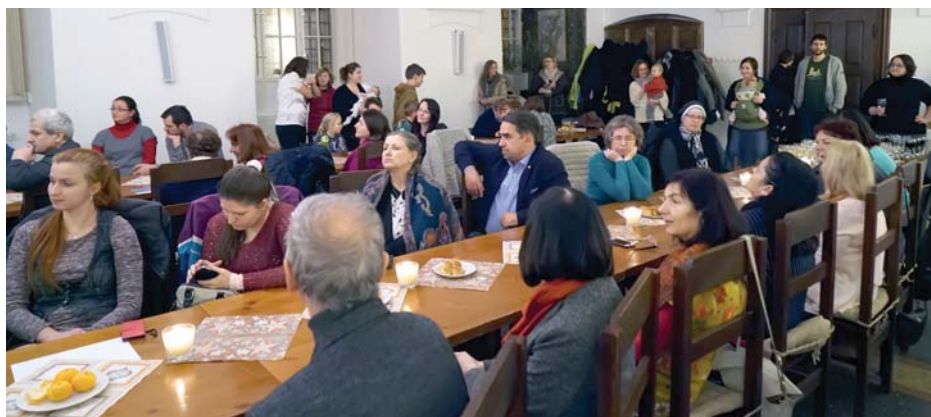
Refektár bratov františkánov sa 7. decembra zaplnil hosťami, ktorým leží osud rodín v krízovej situácii na srdci nielen teoreticky, ale aj prakticky.