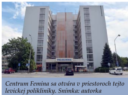
Centrum Femina sa otvára v priestoroch tejto levickej polikliniky.

to reakciou mladých ľudí počas prednášok o vzťahoch muža a ženy. Boja sa pevného záväzku, lebo im chýbajú pozitívne vzory zo svojho okolia. Keď žena nečakane počne dieťa, často ostáva sama bez pomoci, bez opory a ešte sa stretáva s odsúdením vo svojom okolí. Uvedomujeme si, že žena je druhá obeť po dieťati. Preto sme sa rozhodli konať. Nesúdiť, ale pomáhať. Od septembra bude v Leviciach v budove polikliniky otvorené informačno-poradenské centrum, kde ženy dostanú základné informácie a naše pracovníčky ich budú informovať o možnostiach pomoci. Bude to prvé takéto centrum otvorené v priestoroch polikliniky na Slovensku, a práve v okrese, kde to ľudia najviac potrebujú. Do tohto centra s názvom Femina budú môcť prichádzať ženy, ktoré sa ocitnú v ťažkej situácii či už nečakane tehotné, alebo týrané či zneužívané. Žena, ktorá bola na potrate, povedala, že keby sa v jej okolí našiel aspoň jeden človek, ktorý by jej povedal „nechod“, nebola by na potrat išla. Od marca sa skupina ľudí modlí v nemocničnej kaplnke každý utorok za to, aby kultúra života zvíťazila. Sú rôzne typy angažovanosti v pro-life oblasti. Modlitby, osвета, dobrá rada, finančná podpora. Tento projekt bude finančne náročnejší, lebo bude vyžadovať prenájom miestnosti, personálne a materiálne zabezpečenie. Preto prosíme o podporu tohto diela, ktoré môže zachrániť životy detí a pomôcť matkám zachovať svoju dôstojnosť - v tom najohrozenejšom regióne. Práce je veľa, robotníkov málo. Femina vás potrebuje.