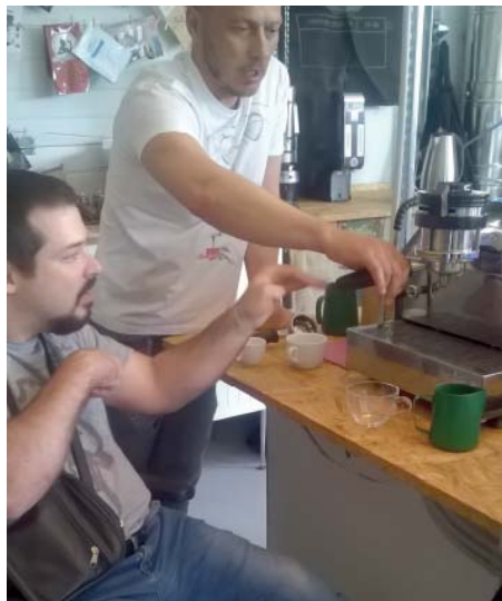
Vedieť pripraviť tú správnu kávu je hotové umenie, tvrdia účastníci kaviarenskeho kurzu, ktorý organizovalo Áno pre život.