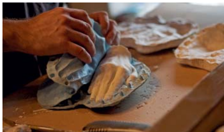
Ruky z bieleho epoxidu pri vyberaní z formy.

a technológiami. Do subtilného povrchu sme vyrezali vodným lúčom ručne písaný autorský font. Symbolizuje osobný odkaz dieťaťa, poznámku v denníku, opakovanie žalmu ako cestu k odpusteniu. V definícii materiálov sme chceli zdôrazniť krehkosť nenarodených, priehľadnosť a zároveň pevnosť hodnoty života. Celá téma je zároveň problematická, čo sme vyjadrili kontrastom nežných rúk a nevinného dieťaťa s drsnejším povrchom podstavca. Našou víziou bolo posunúť klasické pomníkové poňatie objektu k pamätníkovému. Pri kombinácii materiálov s technológiami vzniklo päť verzií prototypov, v ktorých ušľachtilé hrdzavenie, rezanie vodným lúčom, fosfátovanie či chrómovanie vstupuje do dialógu s odliatkami rúk z transparentného epoxidu, umelého kameňa, kararského mramoru alebo kovu.