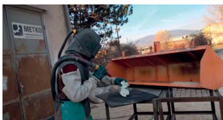
Pieskovanie odliatku rúk na zjednotenie povrchu, prúd piesku obrusuje hrany a nerovnosti.

Texty a foto: Mária Froncová, Stanislav Piatrik