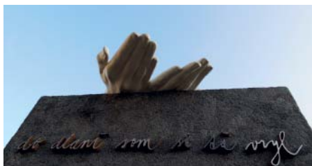
Detail kamennej verzie pamätníka - vizualizácia rozloženia písma pred jeho pochrómovaním.