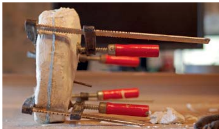
Forma na odlievanie rúk, v ktorej zreje naliata hmota niekoľko hodín až pár dní.