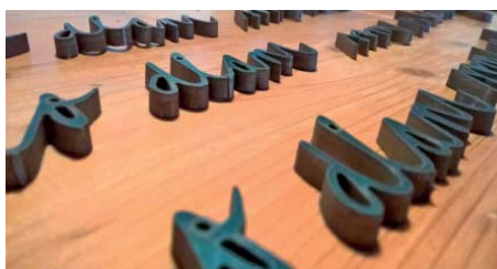
Autorské písmo vyhotovené rezaním vodným lúčom do železa.