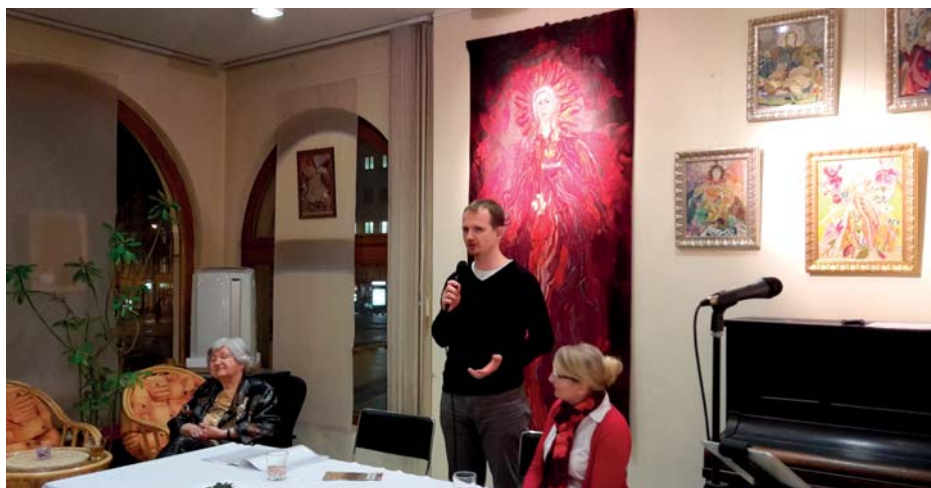
Výstavu si vzalo pod patronát Fórum života.