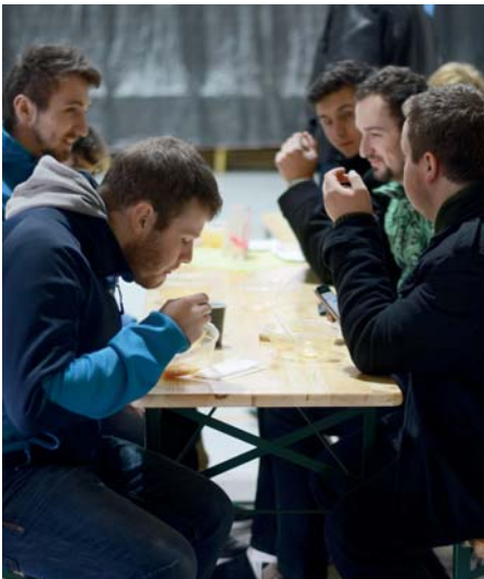
Chutná polievka na Podelíme sa! v Nitre

Veľmi nás oslovilo, že aj Svätý otec František v tohtoročnú Popolcovú stredu predniesol katechézu z cyklu o milosrdenstve s hlavnou témou „Spravodlivosť a vzájomné delenie sa v Božom ľude“. Zdôraznil, že „ak jubileum nedôjde až k vreckám, nie je pravým jubileom“, pričom prítomných vyzval nechať sa inšpirovať Duchom Svätým, aby sa podelili s núdznymi. Cieľom jubilea je podľa neho aj obrátenie, aby sa naše srdce stalo väčším a veľkodušnejším.