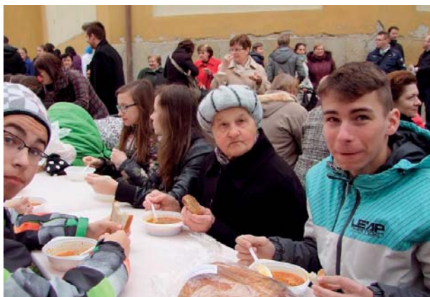
Na polievke si pochutnávali aj v Sereďi. Druhé jedlo si odopreli.

Rok 2010. Výťažok zbierky 17 152 € pomohol Zariadeniu núdzového bývania Dorka v Košiciach. Dokončili všetky stavebné práce a zvýšili kapacity krízového strediska pre mladých dospelých vychádzajúcich z detských domovov z 12 na 22 miest a zariadenia núdzového bývania zo skut-