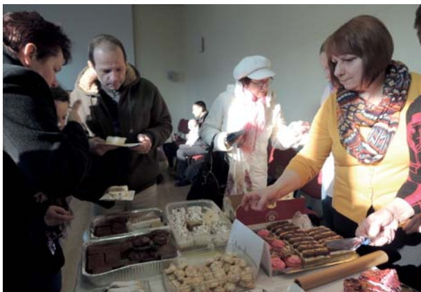
V Novom meste nad Váhom namiesto polievky upiekli koláčiky.