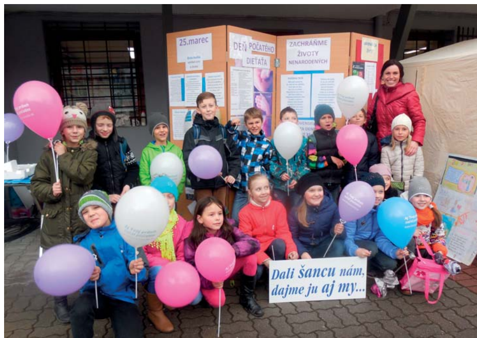
Deti z Námestova oslavujú Deň počatého dieťaťa.